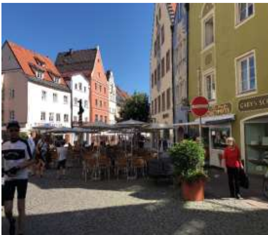
フュッセンの街並み

快晴に恵まれたフュッセン市内で、日独混合グループによる班別自主行動を実施しました。各グループ毎に目的地とコースを事前に話し合った上で、中世の街並みが美しい市内を散策しました。その後、電車でミュンヘン市内に向かい、各ホスト宅へ戻りました。