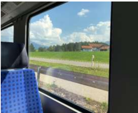
列車窓からの眺め