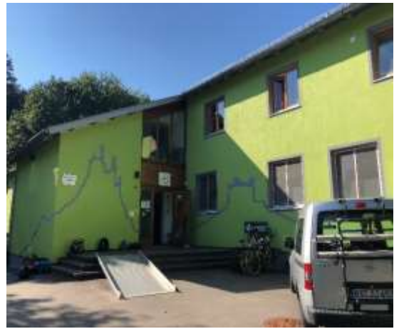
フュッセンのユースホステル