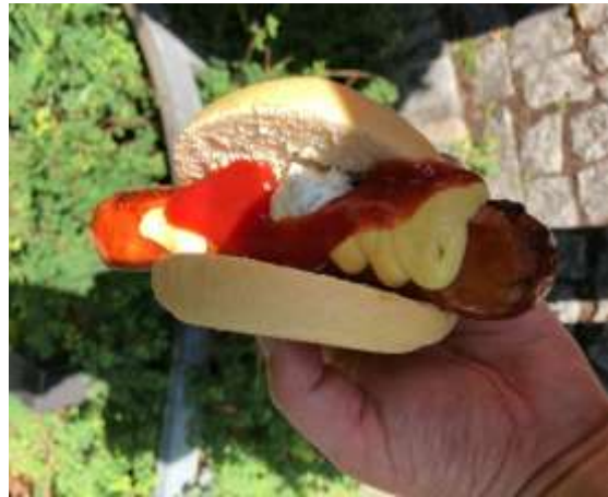
模擬店のホットドッグ