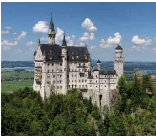
マリエン橋から見たノイシュバンシュタイン城

今回の訪問のハイライトであるノイシュバンシュタイン城へのフィールド・トリップにドイツ人生徒と出かけました。ノイシュバンシュタイン城は 19 世紀にバイエルン王のルートヴィヒ 2 世が建築した城で、現在も工事が完了していない、シンデレラ城のモデルにもなった有名な城です。見学後はフュッセンにあるユースホステルに一泊し、夕食後は日独生徒がミーティングを行い、両国文化について話し合いました。