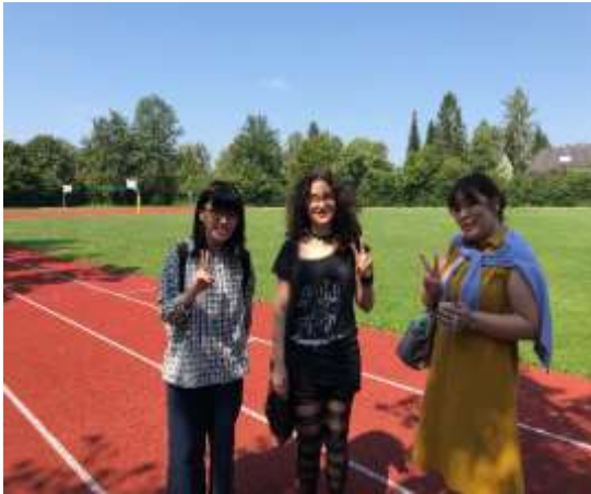
ホスト生徒の学校にて

この日もホスト生徒の学校を訪問し、授業や学校行事に参加しました。英語が通じずにドイツ人生徒とのコミュニケーションに苦戦し、英語学習の重要性を体感した生徒が多かったようです。マックス校ではサマーフェスティバルが行われ、模擬店での飲食やイベントを楽しみました。