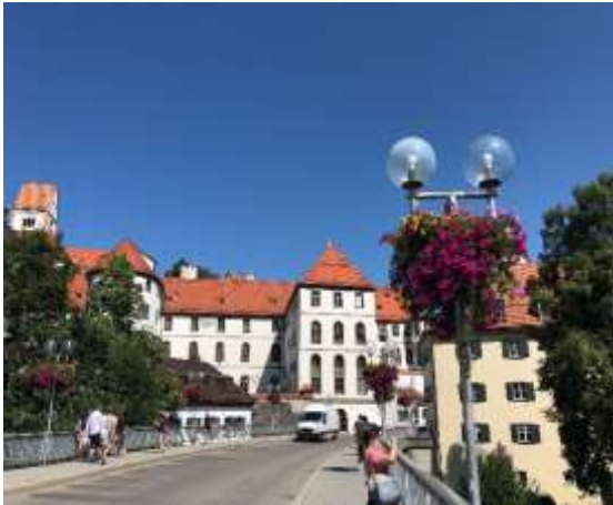
フュッセンの街並み