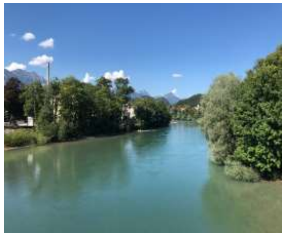
フュッセン市内を流れるレヒ川