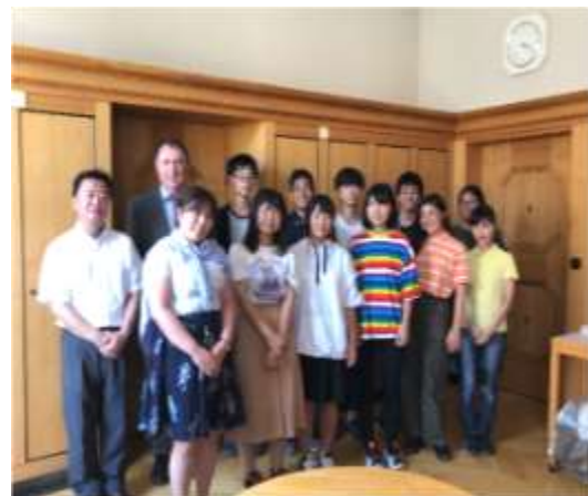
校長先生と記念撮影