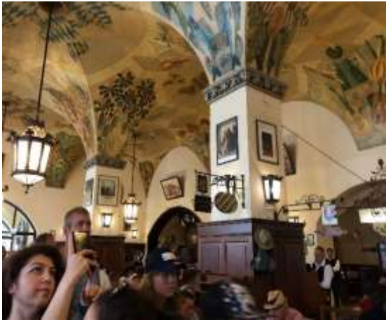
ホーフブローイハウス