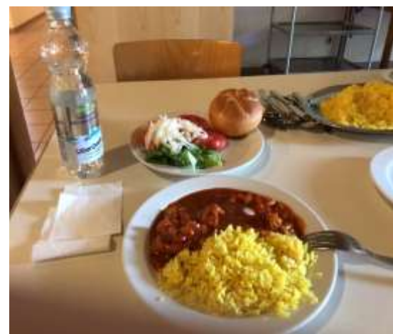
ユースホステルでの夕食