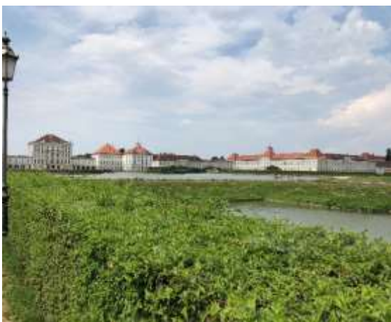
ミュンヘンブルグ城

土日はホストファミリーと過ごしました。郊外へドライブに行ったり、ミュンヘン市内でショッピングを楽しんだり、ドイツでの生活を満喫しました。本校生徒は日曜日の夜にミュンヘン市内のホテルに集合し、ここでホストファミリーとはお別れです。