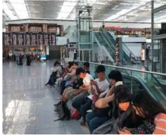
ミュンヘン空港で帰路に就く本校生徒