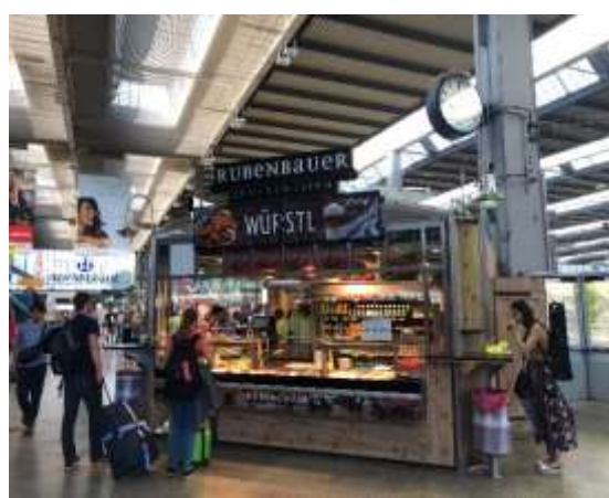
ミュンヘン中央駅の売店