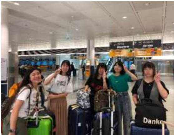
ミュンヘン空港到着

羽田空港を 12：30 に出発した ANA 217 便は 12 時間のフライト後、ドイツ現地時間の 17：20 に無事ミュンヘン空港に到着しました。参加生徒の一部は、空港に迎えに来てくれたホストファミリーと対面し、それ以外の生徒は電車で市内に移動し、中央駅でホストファミリーと対面後、それぞれのホスト宅に向かいました。