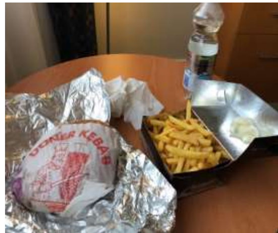
庶民の味方 ドネルケバブ