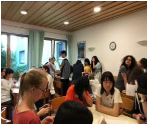
日独ミーティングの様子