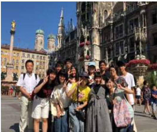
マリエン広場にて

ミュンヘン滞在最終日の午前中は本校生徒だけで最後の市内観光に出かけました。マリエン広場、ビクトアリエン市場、レジデント博物館等を見学後、日本への帰路に就きました。