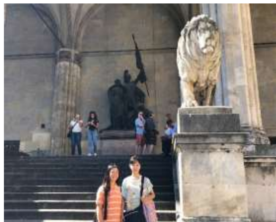
オデオン広場南側のフェルトヘルンハレ