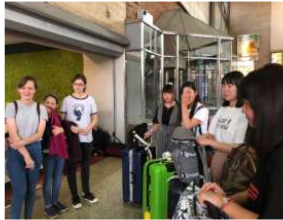
ホストファミリーと対面