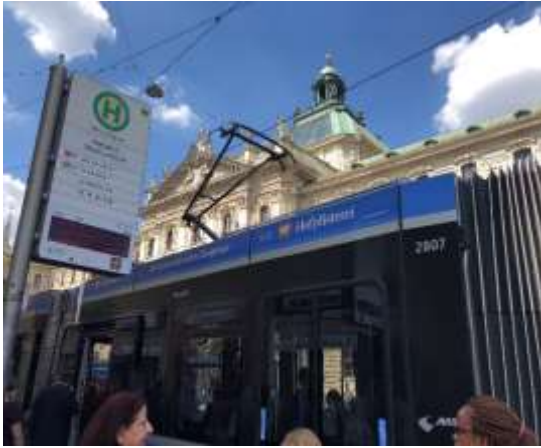
路面電車 カールス広場駅