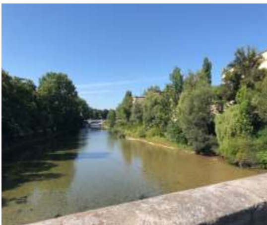
ミュンヘン市内を流れるイザール川