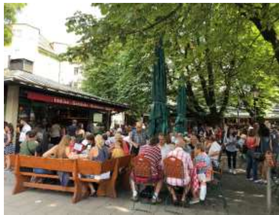
ビクトアリエン市場