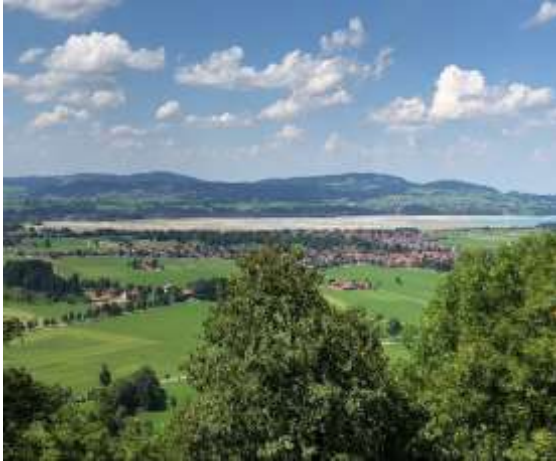
ノイシュバンシュタイン城からの眺め